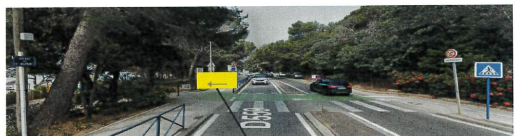
PANNEAUX INTERDICTION ACCÈS + DÉVIATION