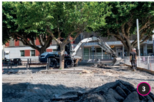
Boulodrome Rénovation du boulodrome place Benjamin Gaillard. Reprise du nivellement et mise en place d'un stabilisé renforcé.