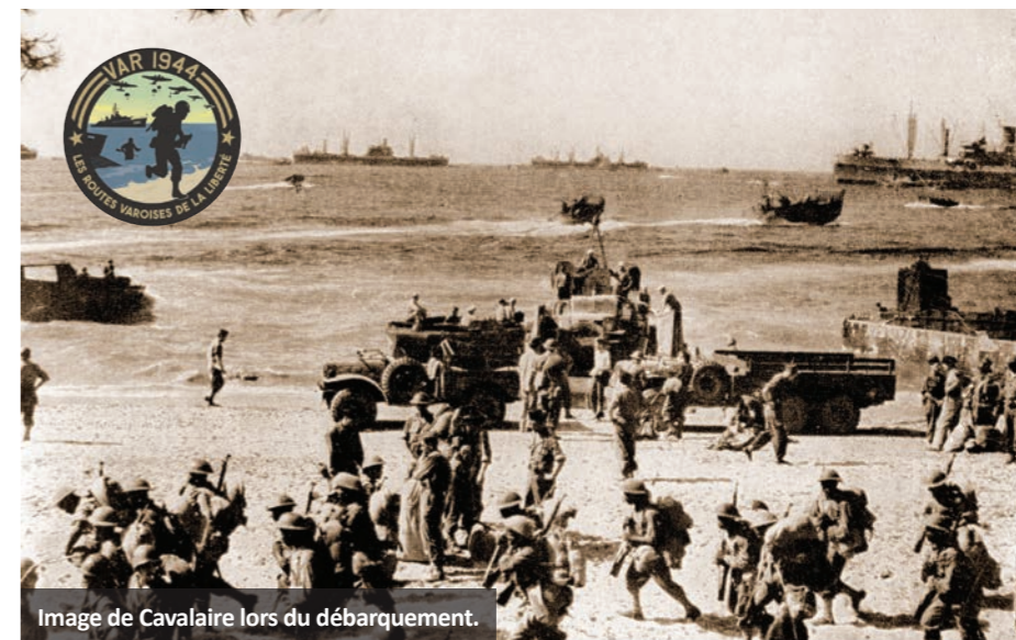
Image de Cavalaire lors du débarquement.