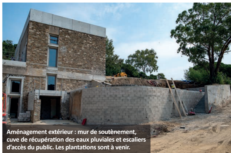
Aménagement extérieur : mur de soutènement, cuve de récupération des eaux pluviales et escaliers d'accès du public. Les plantations sont à venir.

COMME DANS CHAQUE NUMÉRO, NOUS VOUS FAISONS UN PETIT RETOUR DE L'AVANCÉE DES TRAVAUX DE LA MAISON DE LA NATURE, L'USINE. FIN DES TRAVAUX À L'AUTOMNE