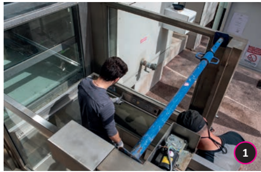
Hôtel de Ville Remise en service du monte-personne pour l'accessibilité PMR.