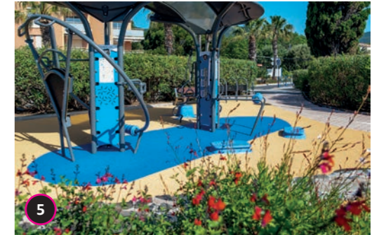
Square de la promenade Création d'une aire de fitness au niveau du square de la promenade. 71 activités sont disponibles pour 12 personnes en simultanément.