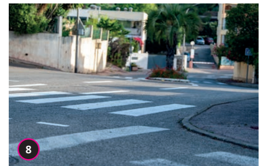
Avenue Mistral Rénovation du marquage au sol.