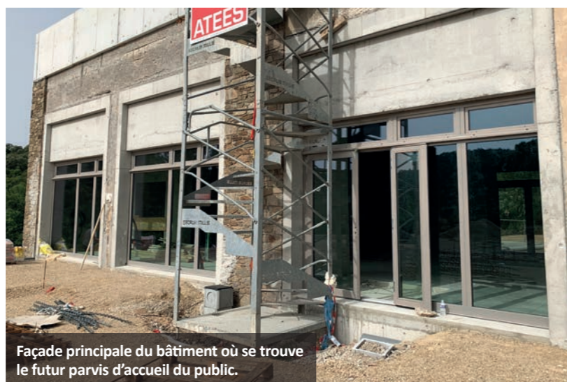
Façade principale du bâtiment où se trouve le futur parvis d'accueil du public.