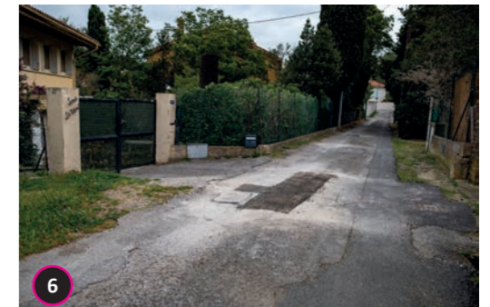
Rue des Maures Reprise de la chaussée.