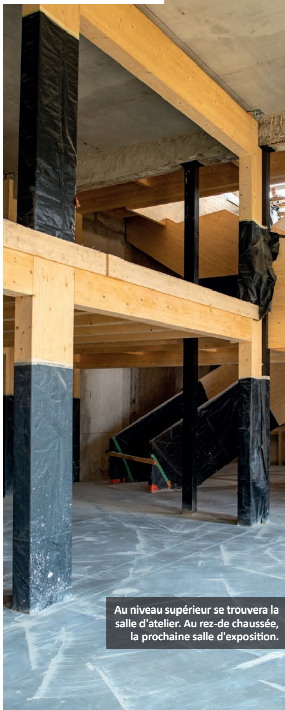
Au niveau supérieur se trouvera la salle d'atelier. Au rez-de chaussée, la prochaine salle d'exposition.