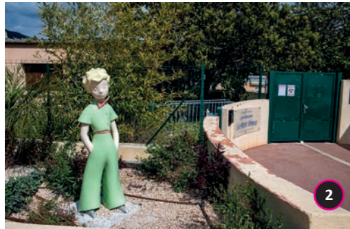
École maternelle Remise en place de la statue du Petit Prince.