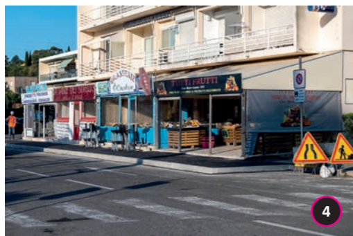
Place du Parc Mise en accessibilité des cheminements piétonniers de la place du parc : création de trottoirs, de passages piéton et mis en conformité des circulations piétonnes.