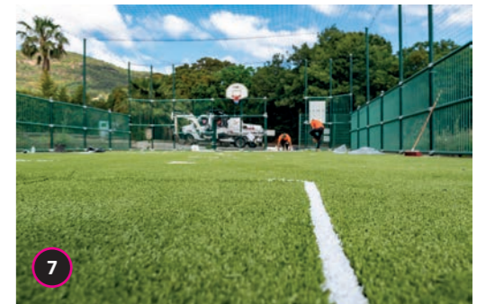
City stade Renouvellement du gazon synthétique du city stade de frais vallon.