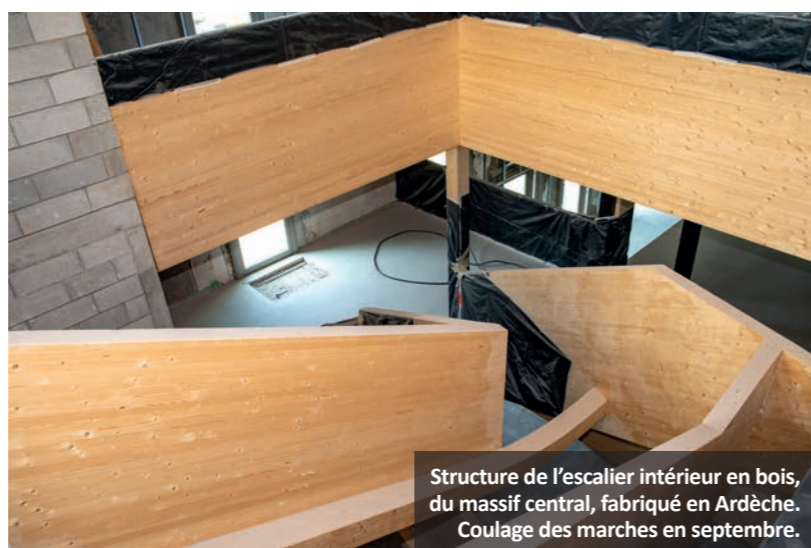
Structure de l'escalier intérieur en bois, du massif central, fabriqué en Ardèche. Coulage des marches en septembre.